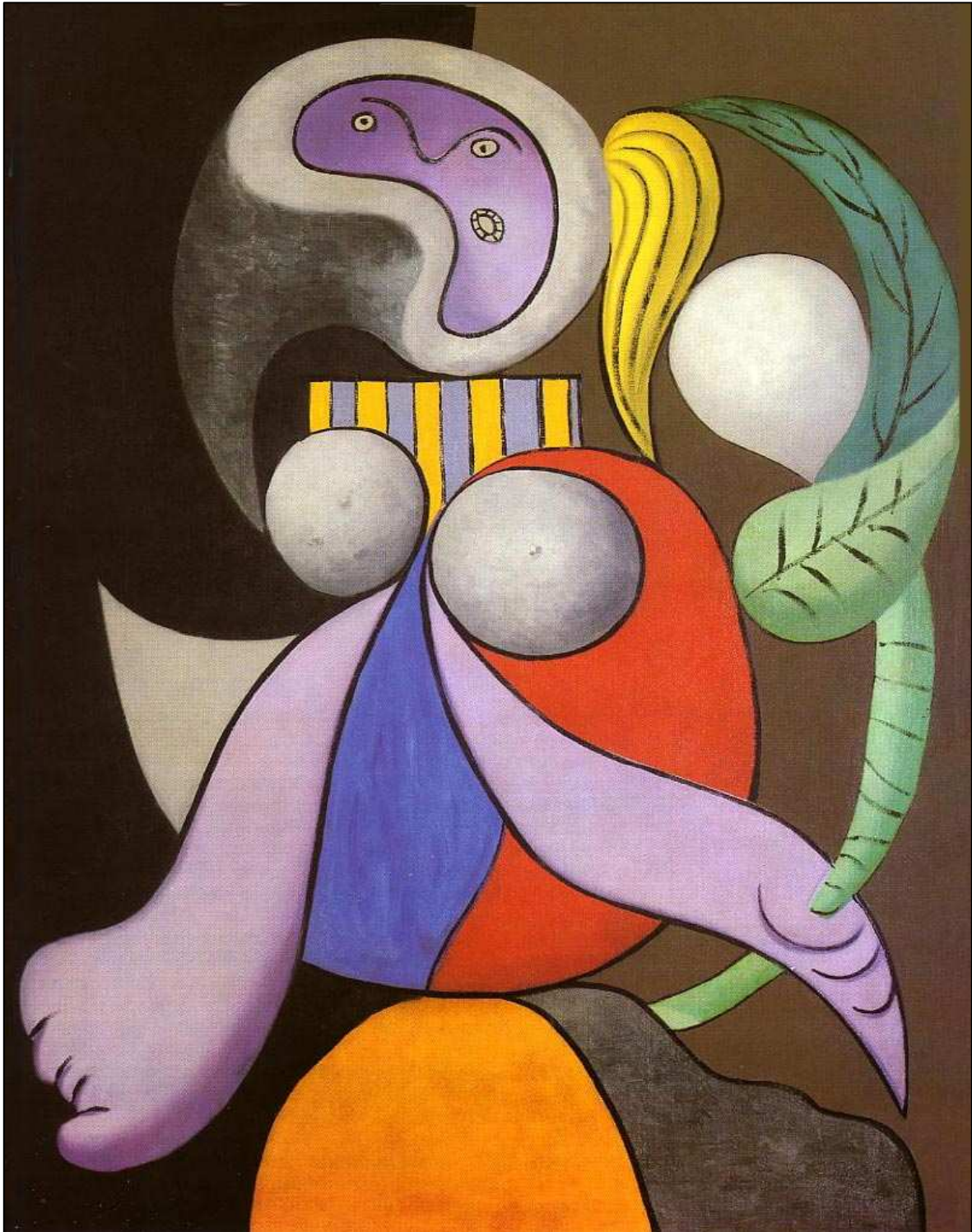
Femme à la fleur de PICASSO