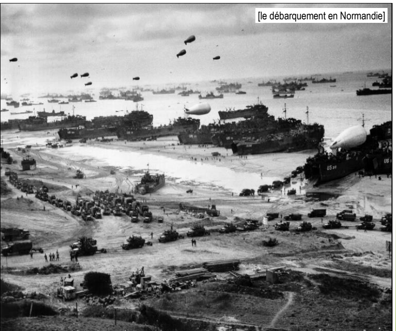
[le débarquement en Normandie]

Le 6 juin 1944, les armées alliées (américains, anglais, canadiens) débarquent en Normandie dans le but de libérer l'Europe (1 213 bateaux de guerre, 736 navires, 864 cargos et 4 126 engins et péniches débarquent 20 000 véhicules et 156 000 hommes sur les plages normandes). Paris est libéré en août 1944. A la fin de 1944, la France est libérée. Charles de Gaulle, chef du gouvernement provisoire de la république, arrive à l'Hôtel de ville de Paris où il fait un discours resté célèbre : « Paris outragé ! Paris brisé ! Paris martyrisé ! Mais Paris libéré ! ». La fin de la guerre est signée le 8 mai 1945.