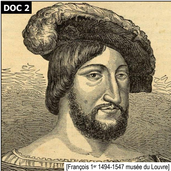
[François 1 er 1494-1547 musée du Louvre]