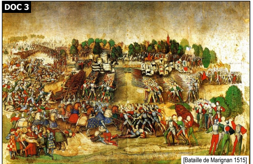
[Bataille de Marignan 1515]