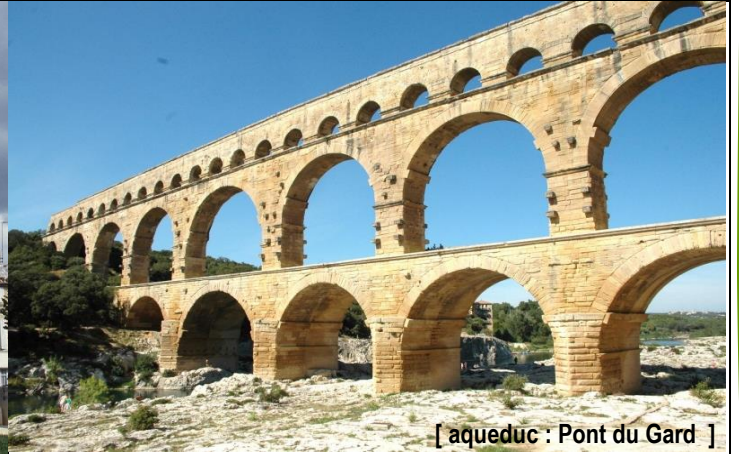
[ aqueduc : Pont du Gard ]

Les architectes construisent de nombreux bâtiments dans les villes Gallo-Romaines. Des temples dédiés au culte d'un Dieu ou d'un personnage célèbre. Des arènes où se déroulaient les jeux du cirque (courses de chars...). Des arcs de triomphe pour célébrer un événement ou un personnage glorieux. Des aqueducs pour acheminer l'eau dans les villes. Et aussi des thermes, lieux de détente et d'hygiène, ancêtres des bains publics, très appréciés par les Gallo-Romains.