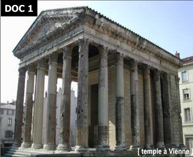
[ temple à Vienne ]