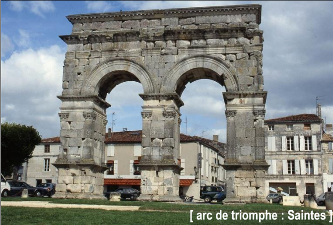
[ arc de triomphe : Saintes ]