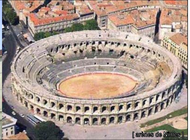
[ arènes de Nîmes ]