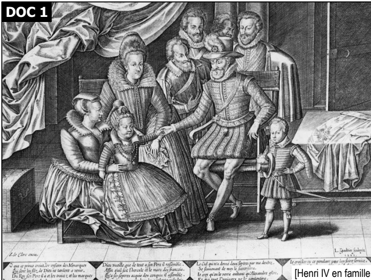
[Henri IV en famille]