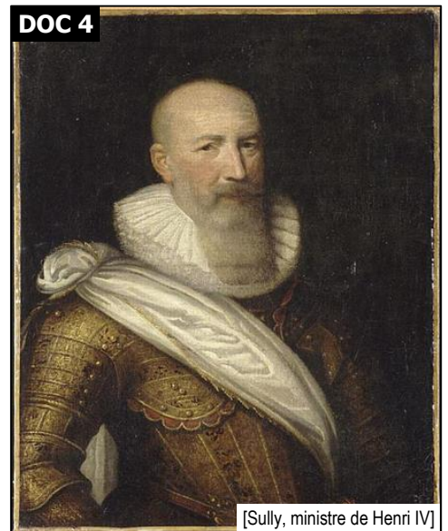
[Sully, ministre de Henri IV]