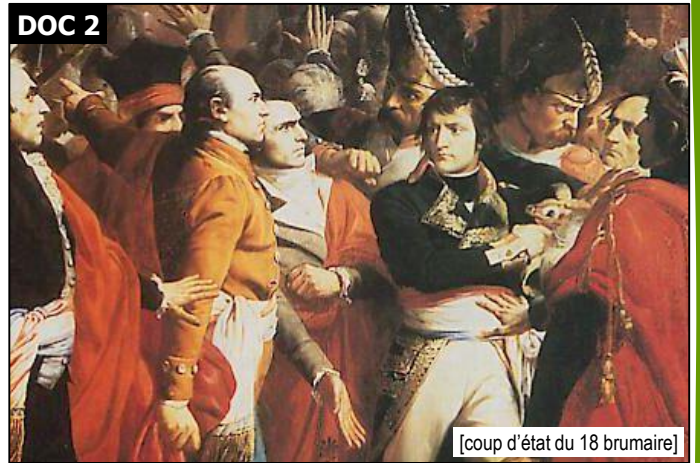
[coup d'état du 18 brumaire]