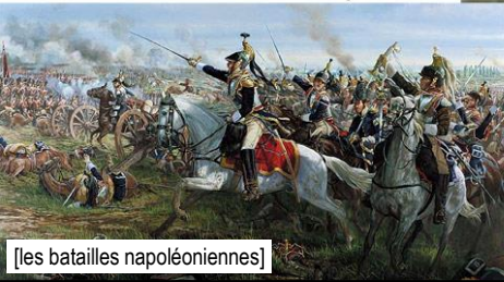
Waterloo : juin 1815