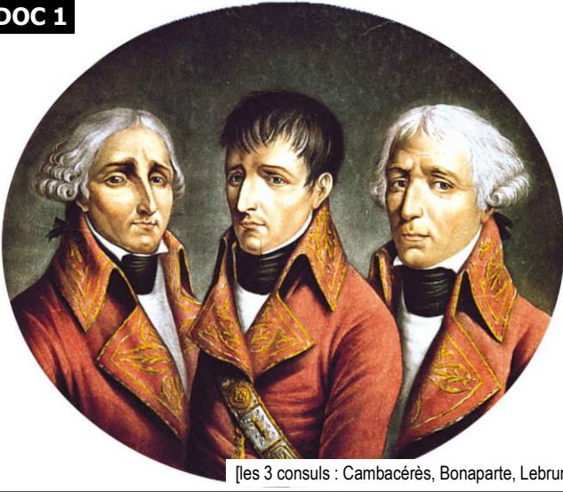
[les 3 consuls : Cambacérès, Bonaparte, Lebrun]