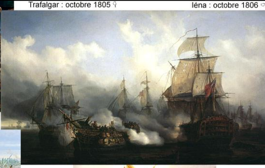
Trafalgar : octobre 1805