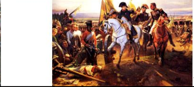
Friedland : juin 1807