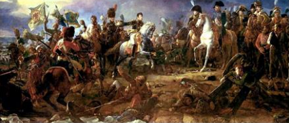
Austerlitz : décembre 1805