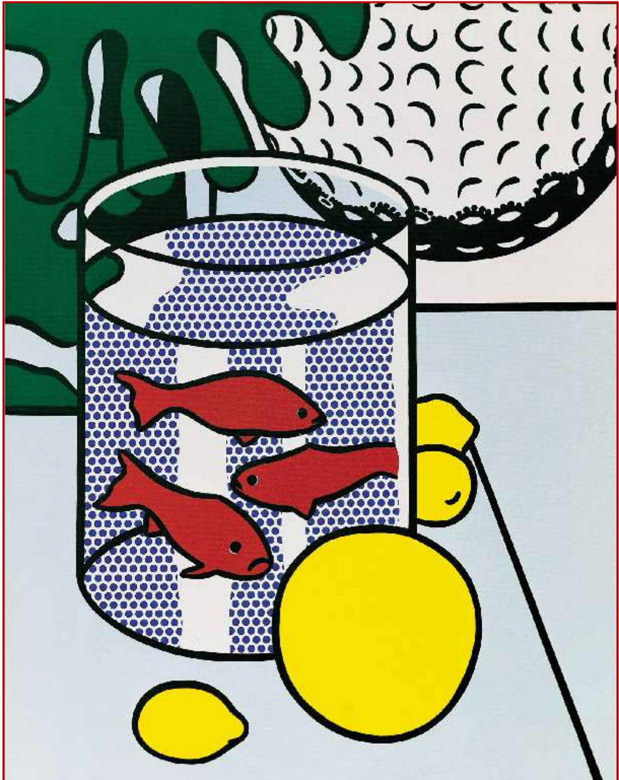
Verre à poissons rouges de Roy LIECHTENSTEIN