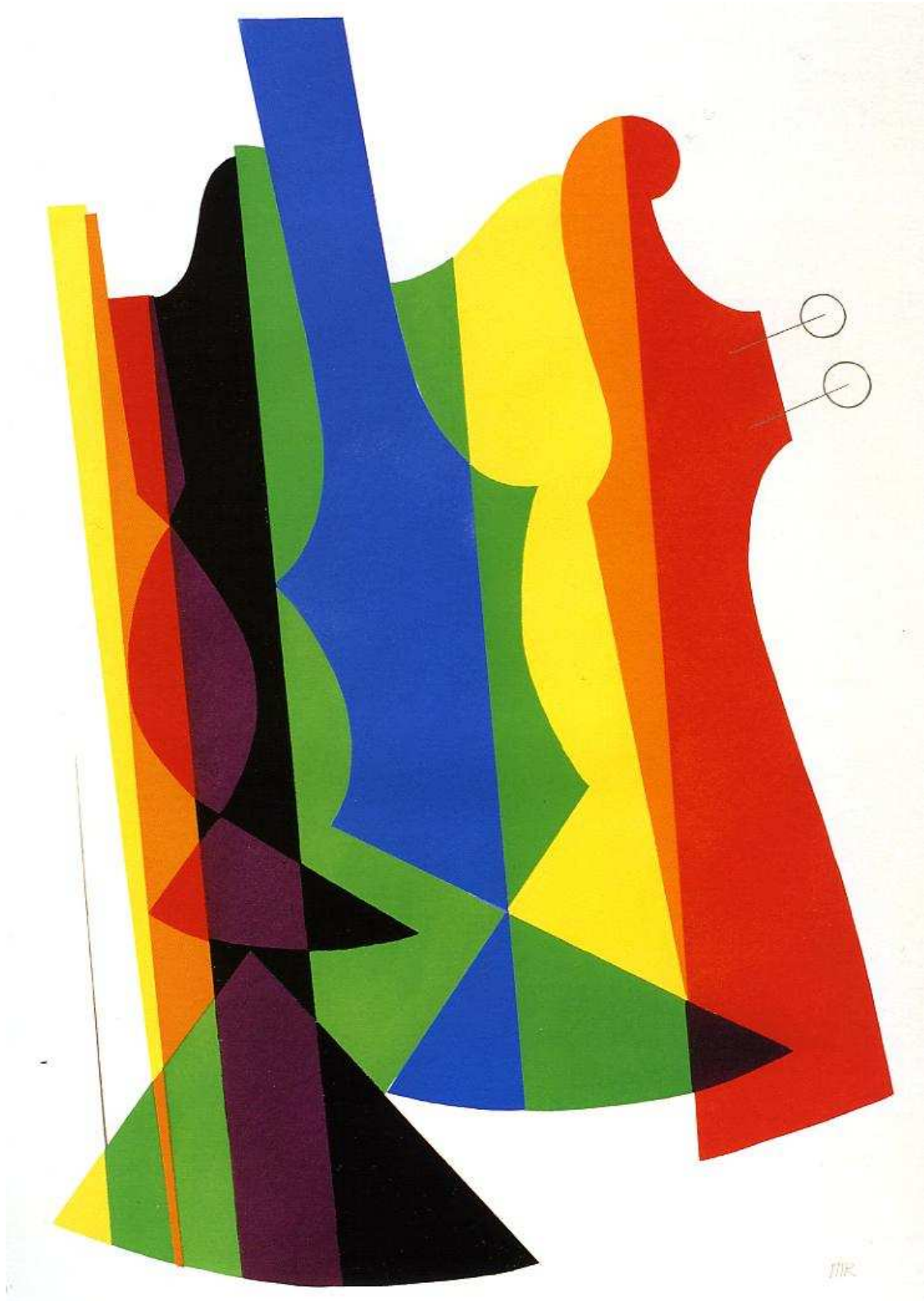
Revolving Doors III Orchestra de Man RAY