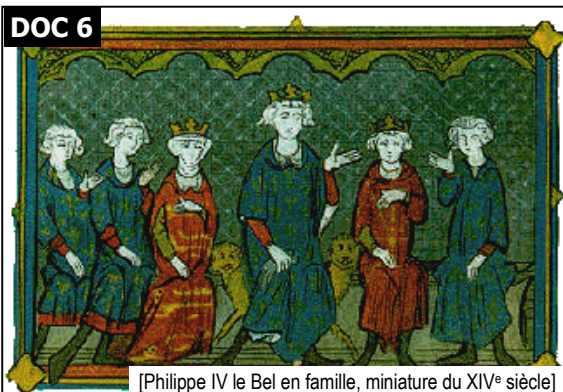
[Philippe IV le Bel en famille, miniature du XIV e siècle]