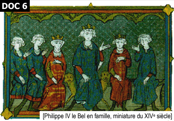
[Philippe IV le Bel en famille, miniature du XIV e siècle]

Philippe IV le Bel a été le dernier des grands capétiens. Après sa mort et celle de ses trois fils, une crise de succession débouchera sur la guerre de Cent ans.