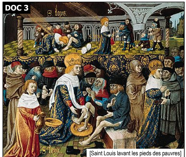
[Saint Louis lavant les pieds des pauvres]