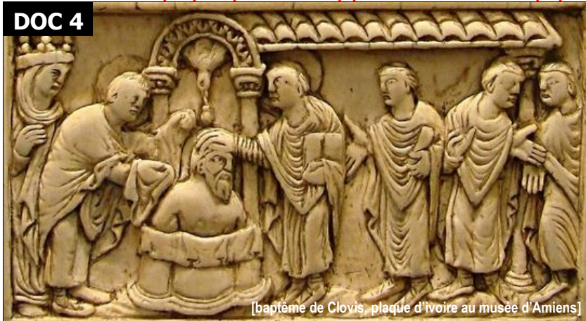
[baptême de Clovis, plaque d'ivoire au musée d'Amiens]

« La reine Clotilde demandait sans cesse à son mari de se convertir. Mais elle ne parvenait pas à le convaincre. Un jour, la guerre fut déclenchée contre les Alamans. Le conflit dégénéra en un violent massacre et l'armée de Clovis fut sur le point d'être vaincue. Emu jusqu'aux larmes, Clovis s'écria : « Jésus-Christ, je te demande ton aide. Si tu me donnes la victoire, je me ferai baptiser en ton nom. » Au moment même où il disait ces mots, les Alamans commencèrent à prendre la fuite. »