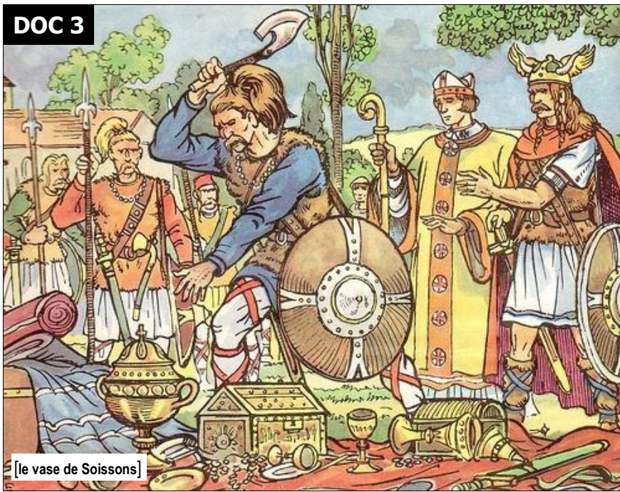
[Le vase de Soissons]

« En arrivant à Soissons, Clovis dit aux soldats : « Je vous prie de bien vouloir me donner ce vase. » A ces mots, les soldats répondirent ; « Glorieux roi, tout ce que nous voyons ici est à toi. » Mais l'un des soldats, jaloux, brandit sa hache et frappa le vase.