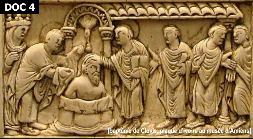
[baptême de Clovis, plaque d'ivoire au musée d'Amiens]

« La reine Clotilde demandait sans cesse à son mari de se convertir. Mais elle ne parvenait pas à le convaincre. Un jour, la guerre fut déclenchée contre les Alamans. Le conflit dégénéra en un violent massacre et l'armée de Clovis fut sur le point d'être vaincue. Emu jusqu'aux larmes, Clovis s'écria : « Jésus-Christ, je te demande ton aide. Si tu me donnes la victoire, je me ferai baptiser en ton nom. » Au moment même où il disait ces mots, les Alamans commencèrent à prendre la fuite. »