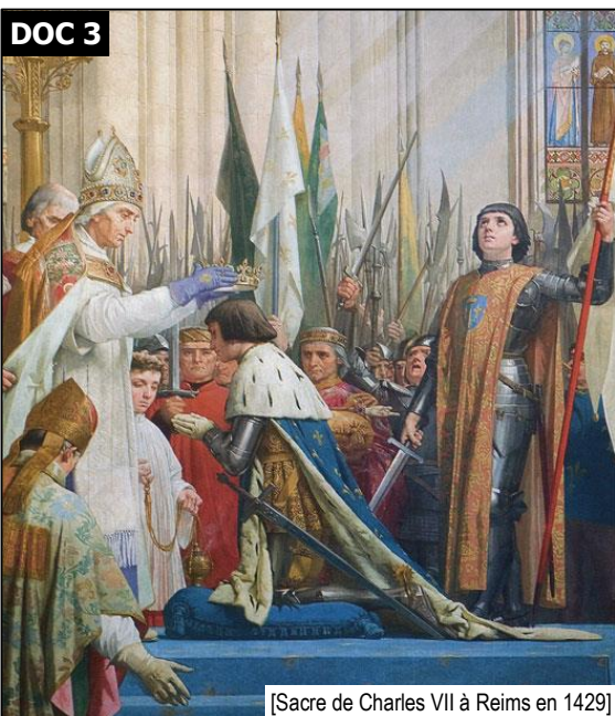
[Sacre de Charles VII à Reims en 1429]

Charles VII avec l'aide de Jeanne d'Arc commence à repousser les Anglais et se fait sacrer roi à Reims en 1429.