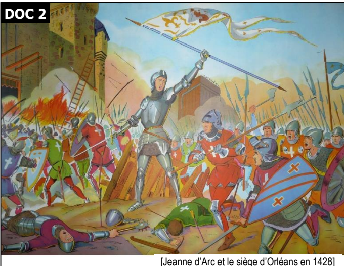
[Jeanne d'Arc et le siège d'Orléans en 1428]

Le roi Charles VI devenu fou, la guerre reprend de plus belle. A sa mort, les Anglais contrôlent la moitié de la France.