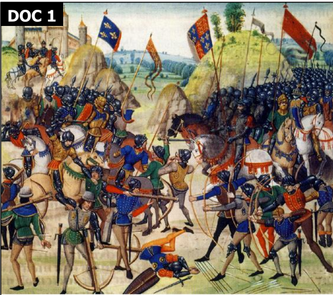
[bataille de Crécy 1346]

Edouard III entre en guerre contre le nouveau roi Philippe IV et lui inflige une défaite sévère à Crécy en 1346.