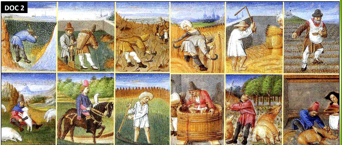
[Travaux des paysans au Moyen-Age]

Au Moyen-Âge, les paysans se divisaient en 2 catégories : les serfs (qui appartenait au seigneur) et les vilains (libres). Ils travaillaient tous pour le seigneur et lui devaient de nombreux impôts (la corvée, le cens...). Tous les travaux sont effectués à la main.