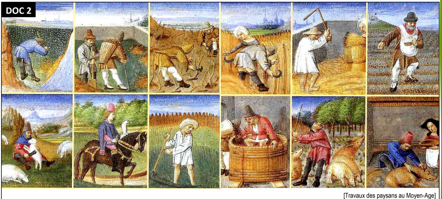
[Travaux des paysans au Moyen-Age]