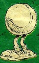
Dessins : Gérard Mathieu

JE NE CONNAIS MÊME PAS CES TYPES, ET ILS M'ARRÊTENT PAS DE M'ENNUIER DES GRANDS OUIJS DE RAQUETTE!