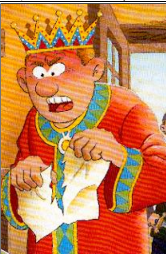
a) le roi