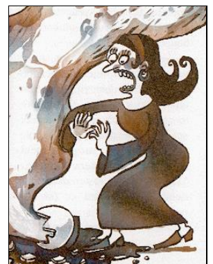
e) Madame ROSA