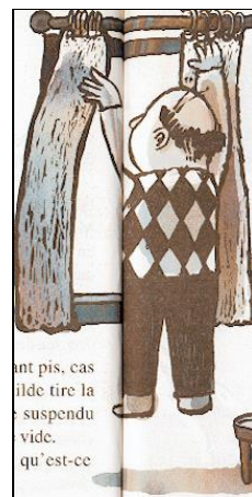
d) Monsieur BRACUS