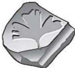
un fossile de plante.....

un fossile de poisson – un Protocéraptor – un fossile de plante – le squelette de Leonardo