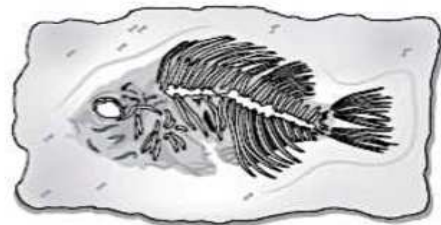
un fossile de poisson.....